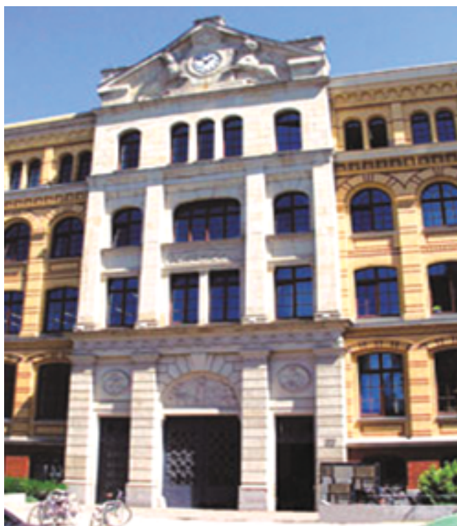
ساختمان مؤسسه ماکس پلانک برای ریاضیات در علوم

گرانشی (مؤسسه آلبرت اینشتین) است. موضوع اصلی تحقیقات این مؤسسه، پژوهش در زمینه اجزاء بنیادی سازنده ماده، برهمکنش‌های آنها، و نقش آنها در اختر فیزیک است. تحقیقات نظری بیشتر معطوف به نظریه میدان برهمکنش قوی، بررسی‌های پدیده شناختی فیزیک انرژی بالا، مطالعه در گسترش‌های ممکن مدل استاندارد، و مبانی ریاضی مکانیک کوانتومی است. تحقیقات تجربی، از جمله، شامل مشارکت گسترده در آزمایش‌های مربوط به فیزیک انرژی بالاست که با همکاری بین‌المللی در شتابنده‌های بزرگ انجام می‌شود.